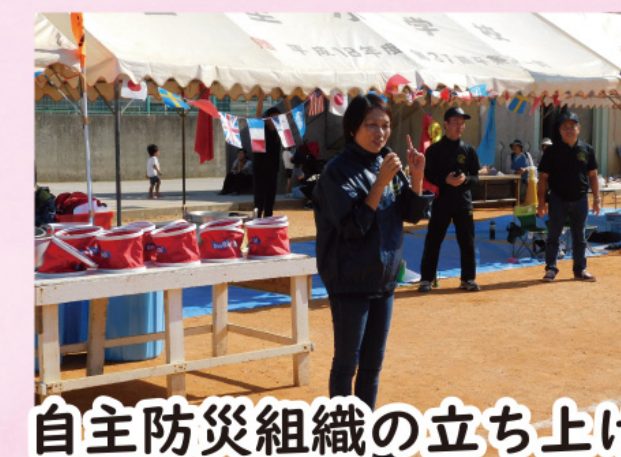
自主防災組織の立ち上げ