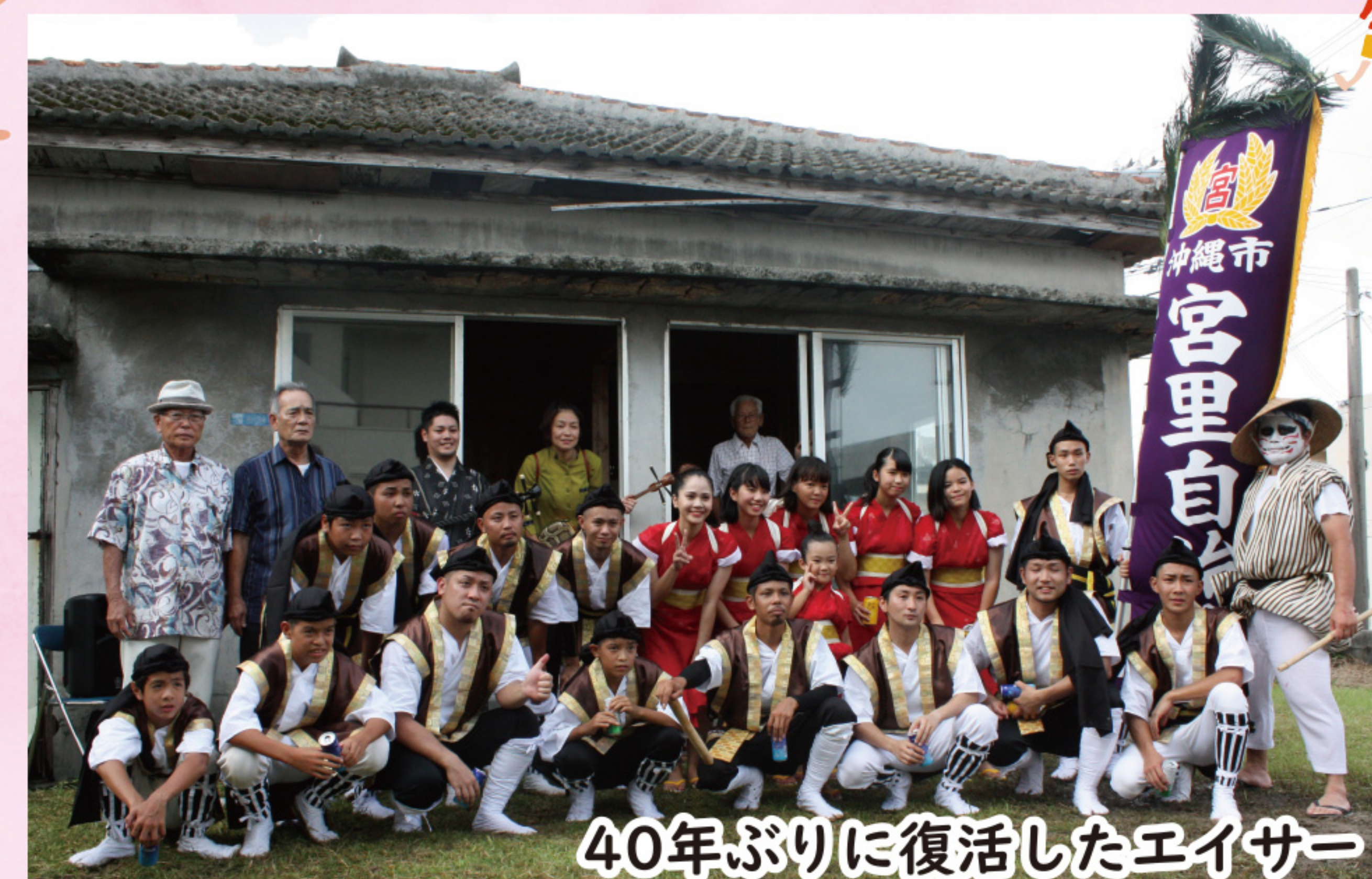
40年ぶりに復活したエイサー